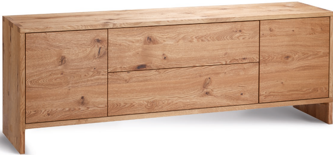
Sideboard NAP in Wildeiche