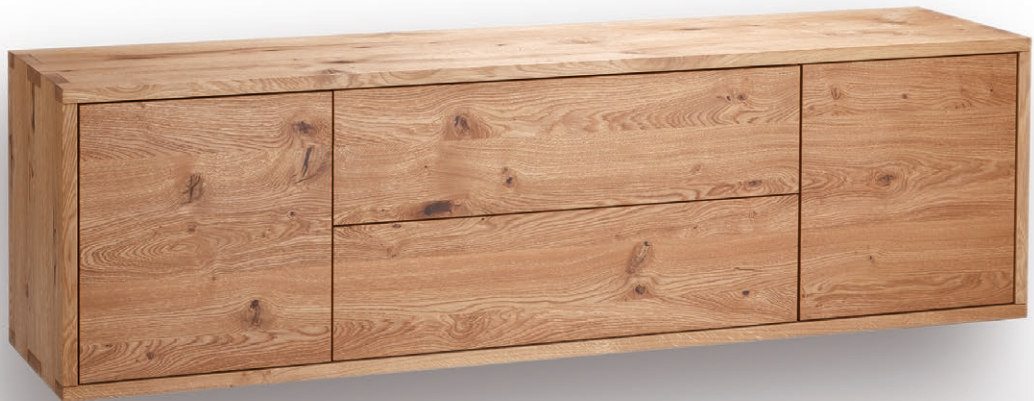
Sideboard NAP für Wandmontage in Wildeiche